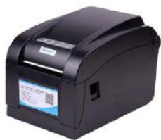
Xprinter XP 350B

XP 350B là sản phẩm mới đang được nhiều khách hàng ưa chuộng hiện nay bởi kiểu dáng nhỏ gọn, giá cả hợp lý. Bộ nhớ 2M Flash và 2M bộ nhớ Dram - Độ phân giải : 203Dpi - Tốc độ in cực nhanh : 4 Inch hoặc 127mm/s - Tự động căn chỉnh kích thước tem nhãn mã vạch - Tương thích với tất cả phần mềm in mã vạch hiện có - Hỗ trợ in mã vạch từ BMP và PCX - Hỗ trợ kết nối : USB - Hỗ trợ in nhãn mã vạch chiều rộng từ 20mm – 80 mm - Kích thước cuộn giấy nhãn mã vạch : Đường kính Max 85mm, lõi 25mm - Tự động kiểm soát nhiệt độ đầu in đảm bảo độ bền đầu in Bảo hành: 12 tháng Xuất xứ: Trung Quốc